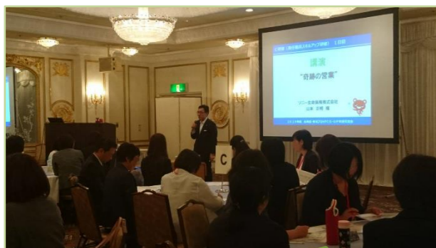
仙台での講演会。皆さん熱心に聴いていただきました。感謝です！