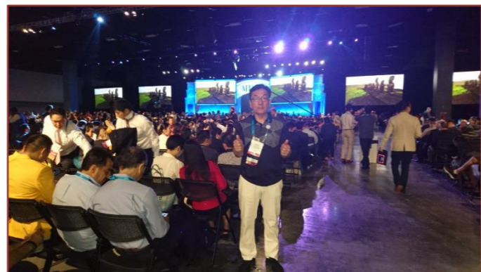
MDRT世界大会inマイアミに参加してきました。今年も世界中から何千人もの仲間が集まり、会場は熱気を帯びていました。