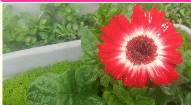
次女(小3)が大神ファームで購入して庭に植えた真っ赤な花