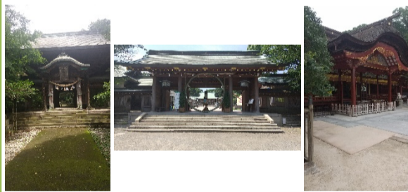
左は豊後国一之宮・柞原八幡宮！中央は大分県護国神社！右は福岡にある大宰府天満宮！

前にも書いたことがあるんですが、私の実家のある鳥取県倉吉市北野には北野神社があり、小学校の中学年位までは毎日のように境内や隣接している広場で遊んでいました。そして、8年前に大分県に引っ越して来た今の自宅の側にも千歳天満社があり、子どもたちは毎日その脇を歩いて小学校に通ってました。そして、今年の夏もとっても暑い日が続いた訳ですが、あまり人が多く集まる場所には出掛け難いこともあり、ついでに運動不足にもなっていたので、どうしたものかと悩んでいました。そんな私に一筋の光が！「そうだ、神社に行こう！！」神に導かれた訳では全くないのですが、この夏神社巡りをしました。神社は比較的人が少なく、木陰が多く涼しい。かつ大きな境内を持つ神社であれば、長～い階段なんかもあり適度な運動にもなります。落ち着いた雰囲気の中ウロウロするだけです。植物や虫、樹齢3000年超の大木などなど、意外と楽しめます。賽銭を入れ、鐘を鳴らし、2礼2拍手し健康で過ごせていることに感謝し、1礼。気分よく、いい汗も流せたので、帰って煩惱のままに美味しいビールをいただく夏になりました。まだまだ修業が足りませんなあ～！！！！