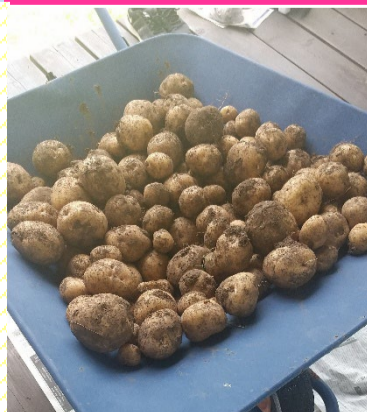
自宅で採れたじゃがいも！ 今年は例年になく豊作でした！！

※減らすことでより良くなることがある。可能性や気を散らすモノを排除して、少ないモノにより良い方法でより深く、より集中して取り組むことで、より多くのコトをより早く成し遂げられる考え方。